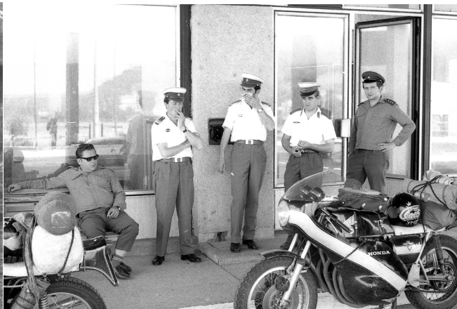
Gränsstationen vid Balassagyarmat. Vi sprängde banken när vi skulle växla in en svensk tusenlapp. Ungrarna fick låna ur tjeckernas växelkassa.