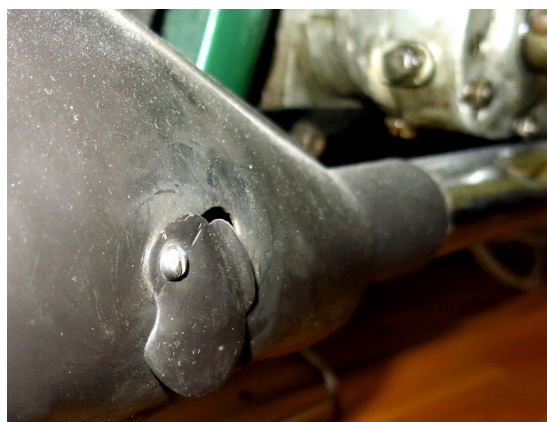
BSA B26 Sports. På bilden till höger ser man ljuddämparen som är har ett hål med ett lock som går att öppna och stänga. Är det någon av läsarna som känner till vad det är till för? Ring 0708437303.