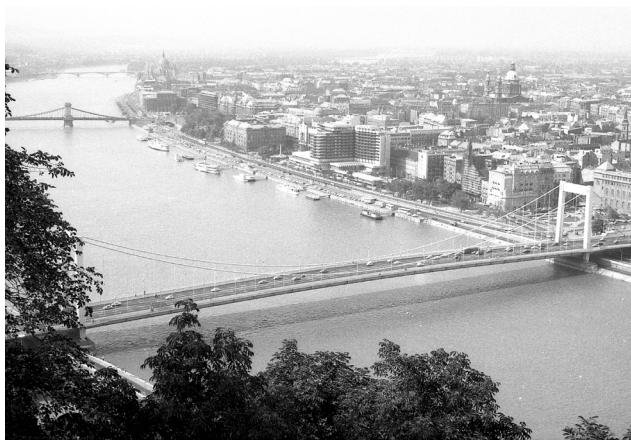
Donau flyter genom Budapest. En mycket vacker stad, rekommenderar ett besök.

vid vårt bord och försåg sig ogenerat av Claes' cigaretter, vilket vi gärna blundade för.