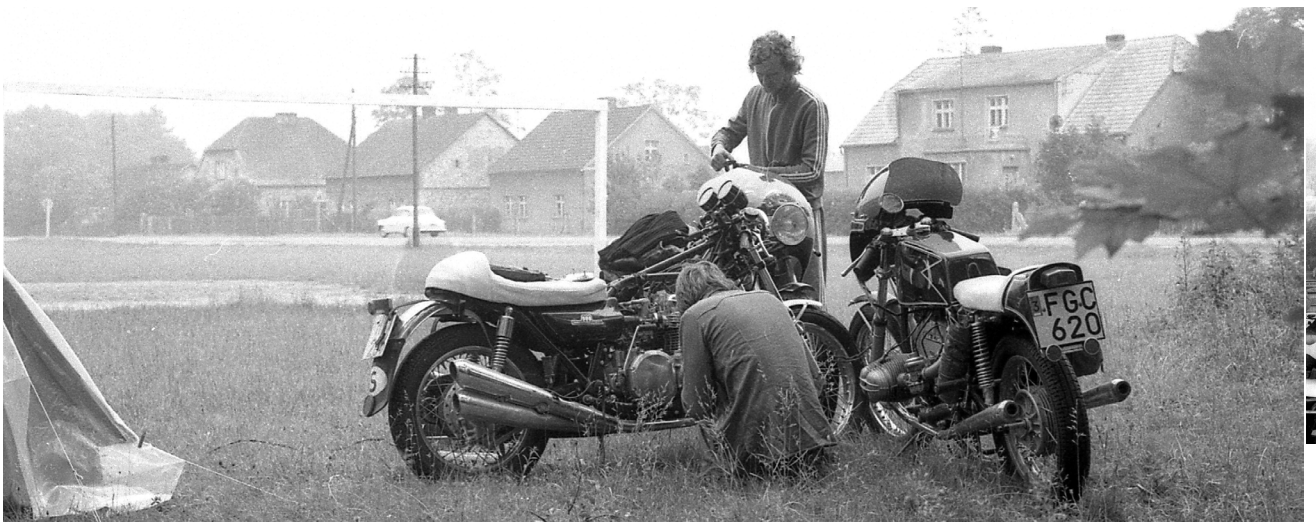
Morgontillsyn av tänder och maskiner vid tältning i Polen.