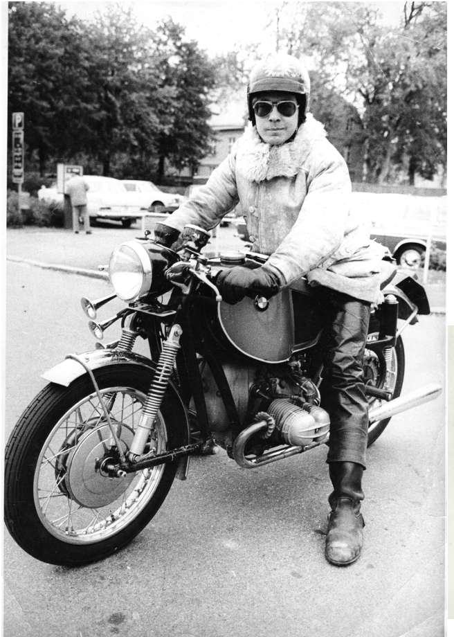
Min första BMW R 69 S. Bild från 1970.

Jag tog mig hem i alla fall. Gick ut i garaget dagen därpå för att ta av motorkåpan och ta en titt på tändningen. Innan jag ens börjat föll min blick på luftrenaren. Då fick jag se. Luftrenaren som sitter ovanpå växellådan har ett chokespjäll som manövreras med ett litet handtag som sticker ut. Luftrenaren hade tydligen suttit lite lös och vridit sig. När det lilla handtaget stötte emot batteriet och luftrenaren fortsatte att vrida sig, stängdes efterhand chokespjället. Bara att rätta till och skruva fast ordentligt, så var det avhjälpt. Värre problem har jag råkat ut för.